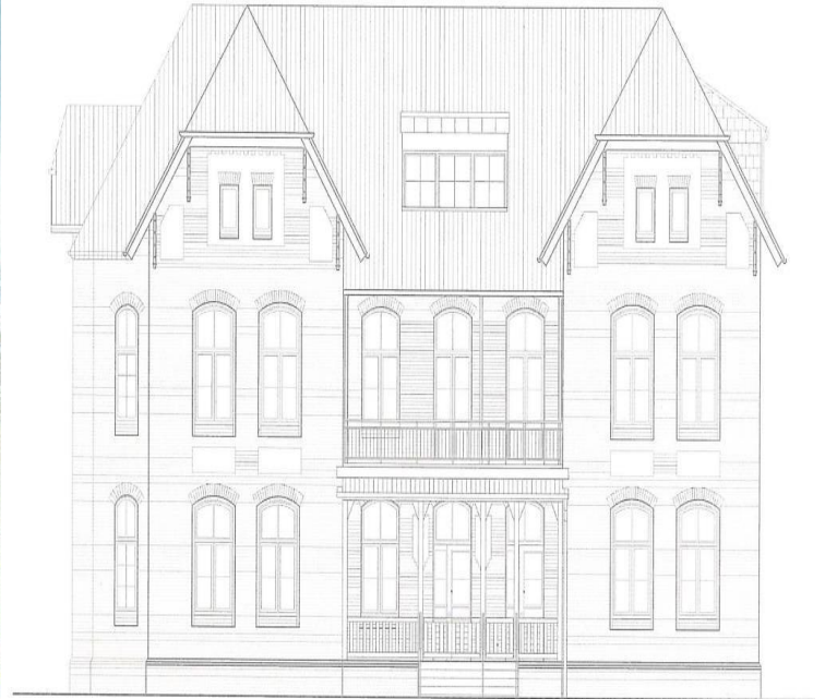
Parkresidenz Haus 7